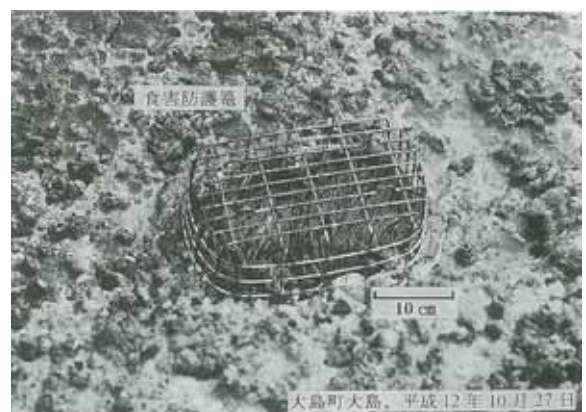
図2 大島町大島地区における食害防護籠の設置状況 籠の設置(平成12年1月24日) 生育状況の観察(平成12年10月27日)

の内側と外側のヒジキの生育状況を調査したところ、いずれの地区でも籠の内側と外側のヒジキでは明らかな生育差がみられました。内側は順調に生育し、葉長が平均8.0cm(1.9~17.0cm)であったのに対し、外側は葉先や茎が切れて短く、葉長は平均1.0cm(0.3~2.2cm)でした(図2・3B)。このことから、藻食性魚類による食害は県下の広い範囲で発生していると考えられます。